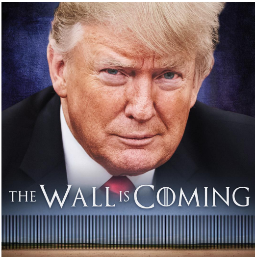
Imagen: The Wall is Coming